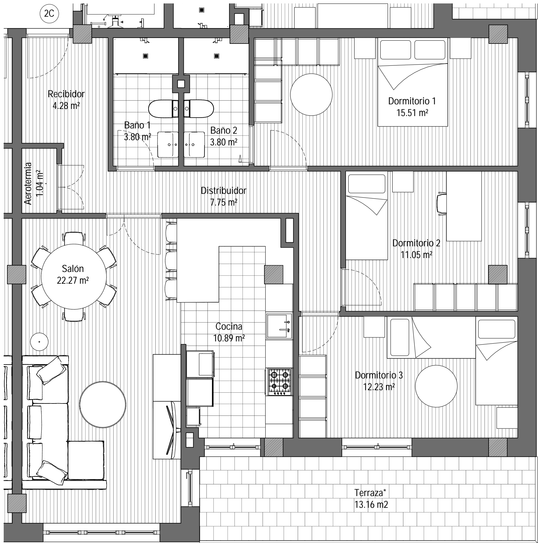
N PORTAL 2, PISO 3º C 0.0 0.5 1.0 1.5 2.0 ESCALA METROS Escala 1:50

*La información contenida en este documento no tiene carácter contractual. Este plano podrá ser modificado por la empresa promotora, según criterio de la dirección facultativa.