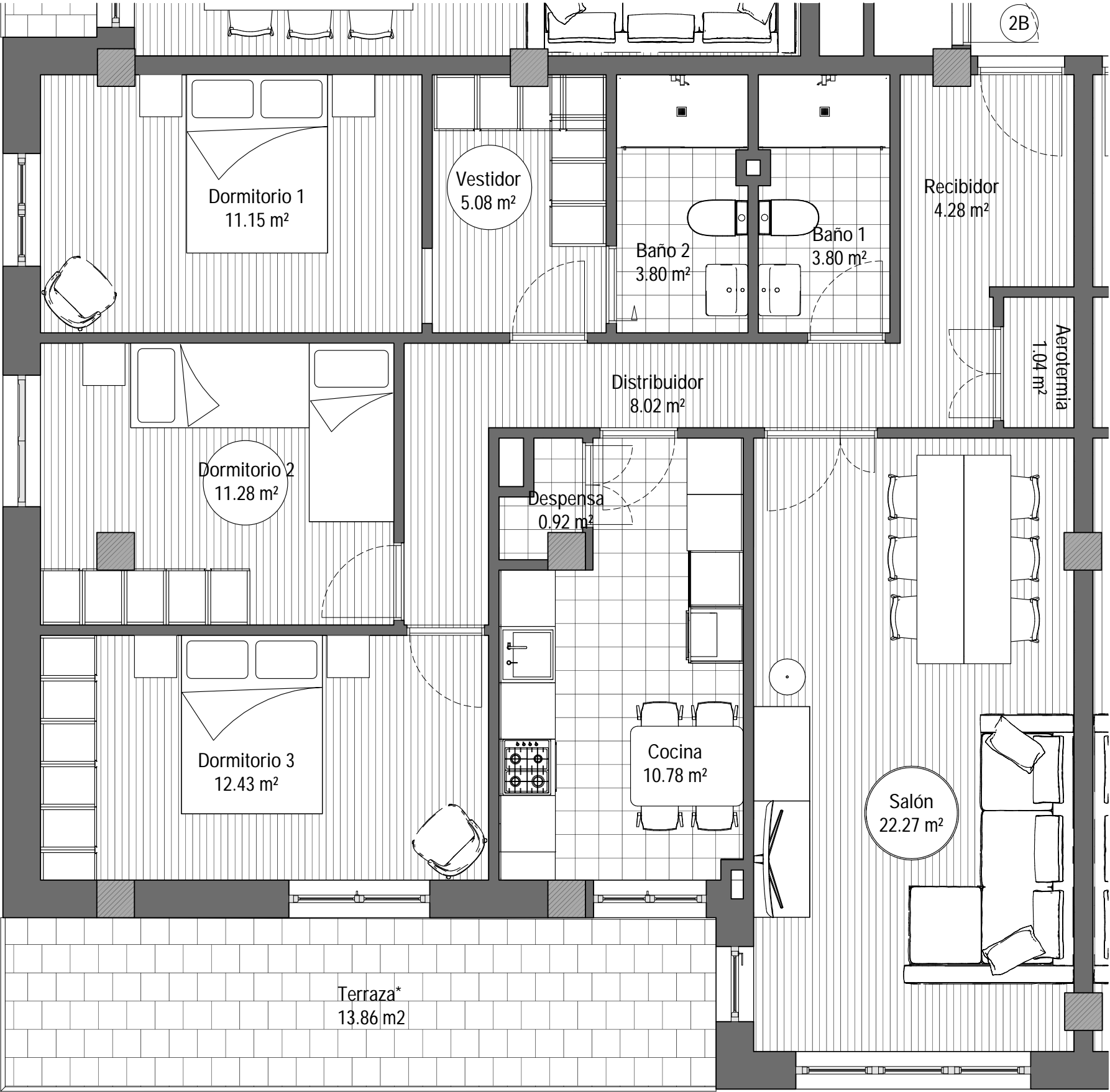
N PORTAL 2, PISO 2º B 0.0 0.5 1.0 1.5 2.0 ESCALA METROS Escala 1:50

*La información contenida en este documento no tiene carácter contractual. Este plano podrá ser modificado por la empresa promotora, según criterio de la dirección facultativa.